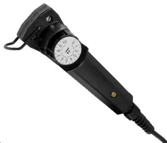
MMA 3 – analoger Fernregler zur Regelung des Schweißstroms

Weitere Informationen erhalten Sie unter esab.com .